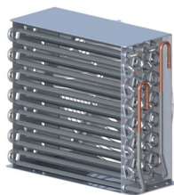
Condenseur révolutionnaire +stayclear à tubes ailetés alliant faible consommation d'énergie et facilité