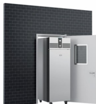
Hauteur réduite pour faciliter le passage des portes